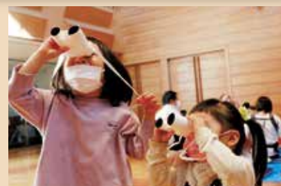
▶ 手作り双眼鏡で室内ボードウォッチングは大盛り上がり

12月4日、川上村文化センターにおいて、第24回図書館まつりが開催されました。コロナウイルスの感染拡大の観点から、飲食物の販売中止、フリーマーケットも出店自粛となりました。