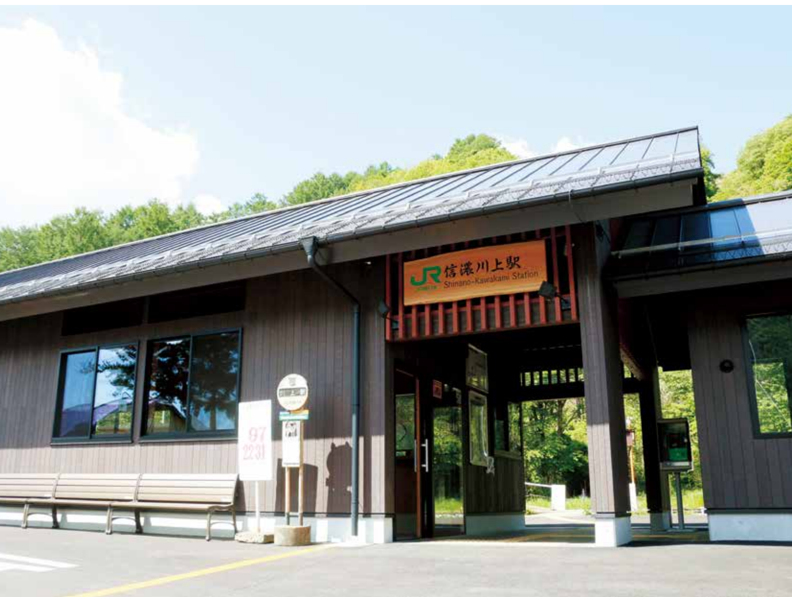
信濃川上駅新駅舎 完成

信 濃川上駅新駅舎が4月下旬、約半年の工事期間を経て営業を開始しました。窓口の奥には広いスペースがあり、観光案内所を開設して川上村の魅力を発信する予定だそうです。待合室は冷暖房完備の個室となっており、冬の寒さも安心です。マスコットの存在、二宮金次郎像は駅の向かいに設置され利用者を見守ります。また、旧舎で利用された駅名板はホーム側に飾られ、夜はライトアップされています。モダンな新駅舎をぜひご利用ください。