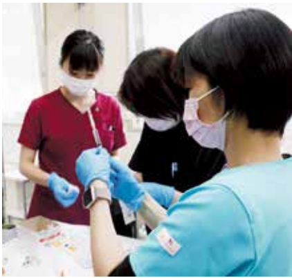
大切なワクチン。準備は手早く慎重に。

新型コロナウイルスの接種が始まりました。最初の対象は65歳以上の高齢者約1300人。5月中旬に第1回、6月上旬に第2回の集団接種が行われました。 診療所では開始1時間前から準備が行われ、注射器でワクチンを吸い上げて、この日の人数分約150本を用意して保管されています。ワクチンは低温冷蔵庫に保管されており、専用の電源を完備して厳重に管理しているそうです。 対象者には接種日時通知が送付され、決められた時間に接種できます。時間を指定することで来場人数を管理し、感染防止対策とともに待ち時間の減少につながっていました。 会場は受付から問診、接種場、待機場と完全な導線となっています。各所では保健福祉課職員が対応してくれてスムーズに接種を受けられます。 接種した方は「注射は思ったより痛くありませんでした。2度の接種が完了してホッとなりました。これで買いたい物にも出かけられます」と安心のご様子でした。 今後は年齢ごとに順次接種する予定だそうです。早くワクチンが行きわたるといいですね。