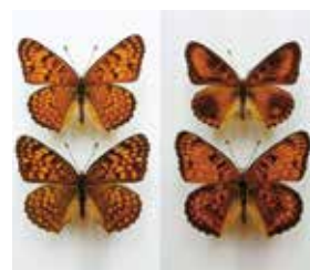
↑ 通常 ↑ 斑紋異常型 (ヒョウモンモドキ)

以上の観点から今後も地球温暖化は進み、村内で観察できる在来種の数は減り、突然変異の蝶の目撃例が増えると思われる、一部の在来種は突発的に大発生する可能性もあると思われます。