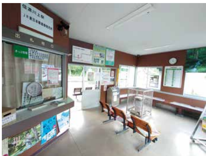
▲ いつもきれいだった待合所。利用者の思い出がたくさん詰まっています。

神奈川県に住んでいたのですが、山林で仕事をするために長野県で林業の就職説明会を受けました。実は20歳の時に秋山で農業アルバイトをしたことがあり、説明会に秋山の方がいらした縁もあって、川上村の森林組合に就職しました。