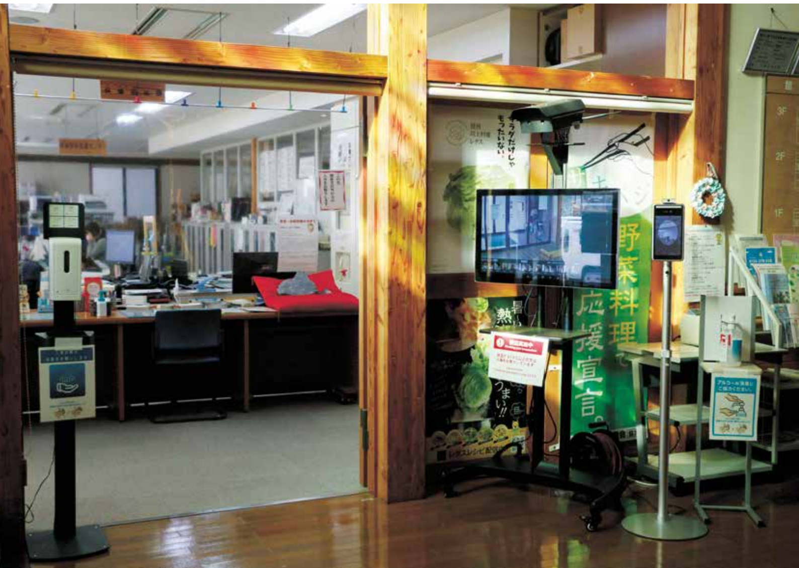
保健福祉課のコロナ対策（2020/11/24）

保 健福祉課の入口でまず目に付くのは、大きなモニターとカメラ。来客を自動で撮影し検温。37.5℃を超えた人は別室のモニターで確認してすぐに対応します。タブレット式体温測定カメラやセンサー式消毒液噴霧器も導入済みで、検診などで感染防止に努めています。また、ヘルススクリーニングでは各自に通知された入場時間の厳守に徹し、密を避けるとともに、待ち時間削減を実現しました。さすがコロナ対策の要、対応は迅速かつ厳重です。