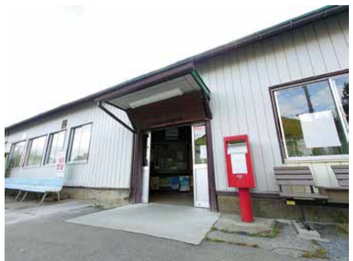
▲ 開業当時、すでに北海道に川上駅があったため「信濃川上駅」としたそうです。駅名看板は新駅舎でも使ってほしいですね。