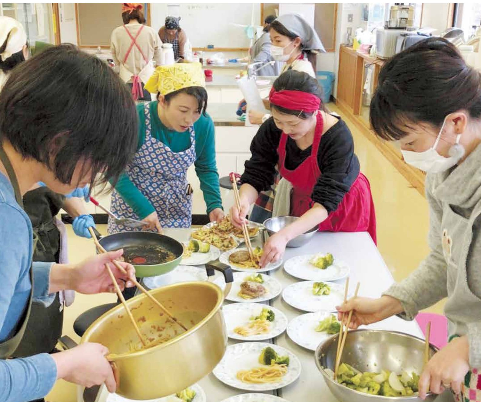
マルシェかわかみ「発酵」料理教室（2020/2/20）

マ ルシェかわかみでは農閑期のワークショップ拡充事業として2月20日に料理教室を開催しました。昨年も好評だった「発酵料理メニュー」にチャレンジ。塩麴や醤油麴を使うことでコクと旨味がUPするだけでなく、主婦に嬉しい時短にも繋がるコツも学べました。