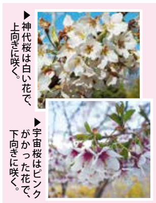
▶神代桜は白い花で、上向きに咲く。