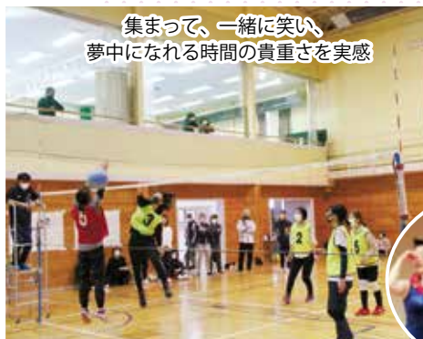
集まって、一緒に笑い、夢中になれる時間の貴重さを実感

参加していただき新たな交流を図っていただくことを願います。これで副館長を退任しますが、私自身、大勢の方々と関わることで、貴重な経験もさせていただきました。ありがとうございました。最後に、在任中にいただきました村民の皆様のご協力に感謝し、公民館が人と人との活気ある交流の場であり続けることを願い、退任のあいさつとさせていただきます。ありがとうございました。