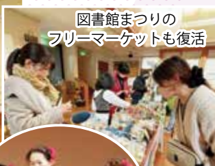
図書館まつりのフリーマーケットも復活