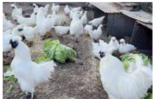
卵をたくさん生むよう品種改良された烏骨鶏。名前はつけていません。