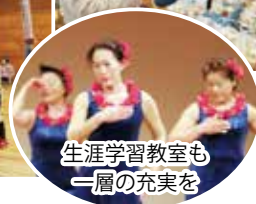
生涯学習教室も一層の充実を