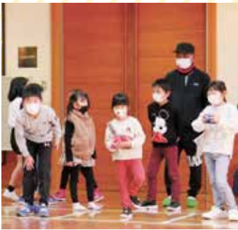
昨年度の総合体育祭のひとコマ 小学生がボッチャに挑戦

いくべきものであり、どれ一つとっても分館長をはじめ各分館役員、スポーツ推進委員、館報編集委員等、関係役員すべての皆様、地域の皆様のご理解とご協力がなければ成り立たないものです。村民が地域活動を通じて気軽に集い、学び合い、交流できる場となる公民館活動ができるよう、微力ではありますが、尽力してまいります。一つ一つの公民館活動が根を張り、枝葉を伸ばし、花が咲き、実を付けるように大きな意味を持つものとなるよう、今後も公民館活動にご協力いただけますようお願いたします。