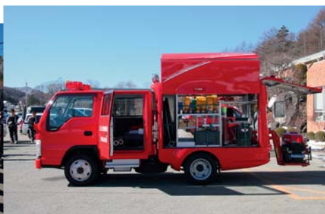
装備品をとり出しやすいガロウイング式