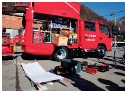
搭載している装備品